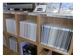
塗装相談コーナー